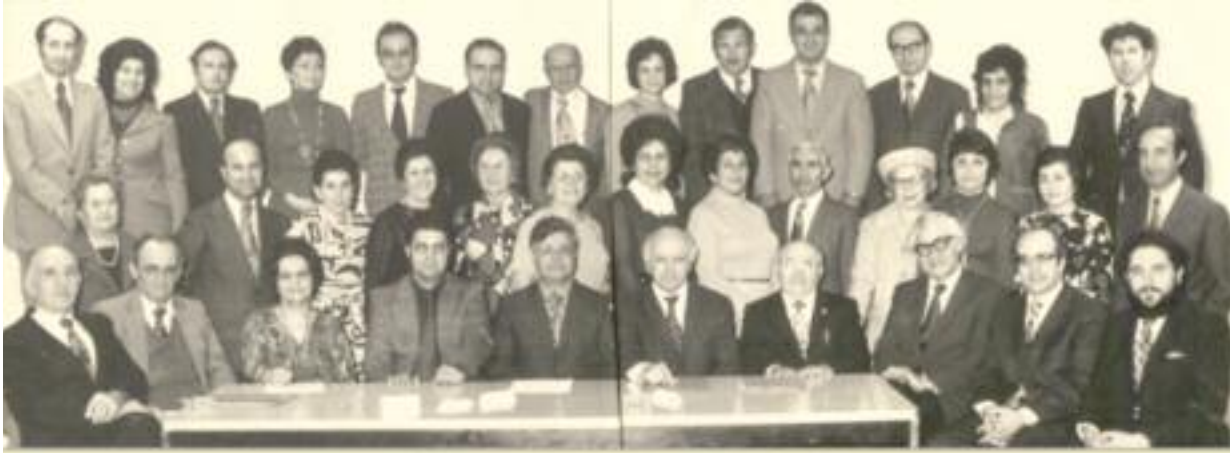
ԹՄՍ Անդրանիկ Պատգամաւորական Ժողովը Նիւ Եորքի մէջ

Հիմնադիրներու Մարմինը կը շարունակէր հասնիլ լիբանանահայութեան կարիքներուն: Ընդառաջելով ԹՄՍ Միացեալ Նահանգներու եւ Գանատայի Կեղրոնական Վարչութեան կոչին, որ 1978ը հարիրամեակի տօնակատարութեանց տարի կը հռչակէր, բովանդակ հայութիւնը,