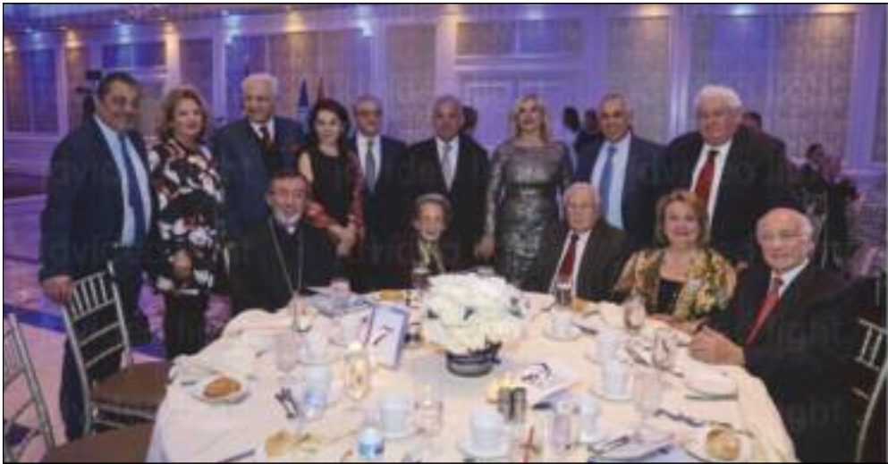
Ներկայ եղող ռամկավար դեկավար ընկերներ շրջապատուած Առաջնորդ Սրբազան Հայրով եւ դէսպան Զօհրայ Մնացականեանի հետ

Մշակոյթը գեղեցկութիւն առաքինութիւն ստեղծող՝ հալածող լոյսի աղբիւր է: 10 Մարտ 1947-ին՝ լուսաւոր մտքի տէր եւ հայ մշակոյթին ծառայելու՝ գաղափարի ուխտեալ ընկերներ, կը հիմնեն Թեքեան