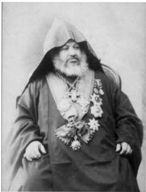
Վերադարձ Մայր Եկեղեցի

Մաղաքիա Արքեպիսկոպոս Օրմանեան Պոլսոյ Պատրիարքական Աթոռին վրայ մնաց 12 տարիներ պատուով եւ արդիւնքով: Իր այդ բարձր եւ փշոտ պաշտօնէն ետք ան ձեռնարկեց գրական լուրջ եւ հեղինակաւոր աշխատանքի: 1910-ին ֆրանսերէն լեզուով հրատարակեց իր ծաւալուն երկը՝ Հայոց Եկեղեցին, գոր շուտով թարգմանեց հայերէնի: Այդ երկը հիմնապէս գրեց օտարներուն համար որպէս «իր առաջին ձեռնարկներէն մին եւ իր հնօրեայ բաղձանքին գործադրութիւնը»: