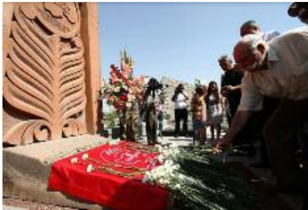
Στιγμιότυπο από το λαϊκό μνημόσυνο των μαρτύρων και των ηρώων του ΑΣΑΛΑ στο Ηρώο του Γεραμπλούρ (Ερεβάν) στις 20 Ιανουαρίου 2018.

Την άρνηση αποδοχής των τετελεσμένων οι μαχητές του ΑΣΑΛΑ την έγγραφαν με το πολυτιμότερο και το πιο ανεξίτηλο μελάνι: το ίδιο το αίμα τους, και την άφησα ν' ως παρακαταθήκη στις μελλοντικές γενιές κι ως