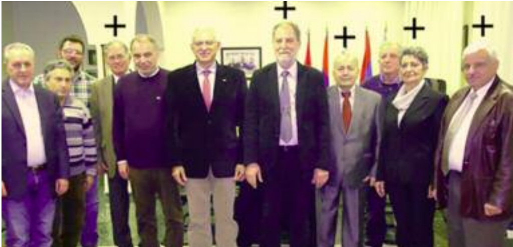
Տօ քօլիտիկօ ցրափիօ տօն ՏԱՏՆԱԿ Եմքլօստիտիք քե յեա մրրր. Եինա անտա քօս քլրրրրր քե տօ ստարօ ստօ կրալի. Կատանտա...

Մարրրի միա կինրրի ստին Աթինա անօ քրօսքօա կատա տօ քլրրրտօն քօրիտ Իտօրիա կաի անօնր, քանրիլօս մօրփօտիկօս Եմիքրրօս. Ի կինրրի Եքի կօմքատիկօ քարաքիրա կաի Ենօրափրրի տօ ՐԱԳ. Գիաքի տօ Ենօրափրրի; Ըիօտի օիկրիօքրիօրիա տօն տիտլօ, կաի քօրիտ յա կօկքինիքի անօ յտրօքի, Եմփանիքրա աս ՐԱԳ քե սկօքօ տի Ըսփքիմիտի տօ.