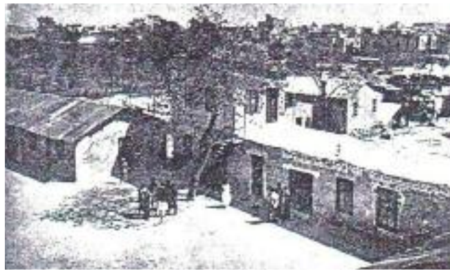
Հ.Բ.Ը:Միութեան Կիլիկեան Որբանոց-Արհեստանոց

էր յարութիւն առնելու եւ յարատեւելու առասպելական գաղտնիքը: Հայը ինկաւ, բայց չմեռաւ: Այրեցաւ եւ փիւնիկի պէս մոխիրներէն յառնեցաւ: Հակառակ թուրքին սփռած ակերին, մոխիրին ու յօշոտումին, իր գործադրած վայրագութիւններուն ու ճիւղային ծրագիրին, ապրեցաւ հայը ազատութեան, յոյսի եւ գալիքի տեսիլքով, շարունակեց իր գոյերը, հատուցման ուղին գտնելով ապրելու եւ մաքառելու մէջ: