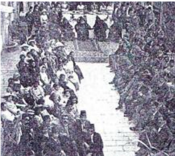
Նախագահութեամբ Վեհ. Սահակ Բ. Կաթողիկոսի ԳԲԸՄիութեան Հայկախի Մասնաճիւղի երեկոյթը

Հայ ժողովուրդի ծագման մասին հնագոյն ժամանակաշրջաններու վերաբերեալ եղած պատկերացումներուն համաձայն, հին ժամանակներէն Քրիստոսէ շատ դարեր առաջ հայոց մայրաքաղաքը «Հիթիթներու եւ Հայերու» մասին տեսութեան համաձայն, հաստատուած էին Սուրիոյ պատմական տարածքներուն վրայ: