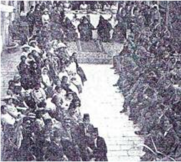
Նախագահութեամբ Վեհ. Սահակ Բ. Կաթողիկոսի ԳԲԸՄիութեան Հայկախի Մասնաճիւղի երեկոյթը

Հայ ժողովուրդի ծագման մասին հնագոյն ժամանակաշրջաններու վերաբերեալ եղած պատկերացումներուն համաձայն, հին ժամանակներէն Քրիստոսէ շատ դարեր առաջ հայոց մայրաքաղաքը «Հիթիթներու եւ Հայերու» մասին տեսութեան համաձայն, հաստատուած էին Սուրիոյ պատմական տարածքներուն վրայ: