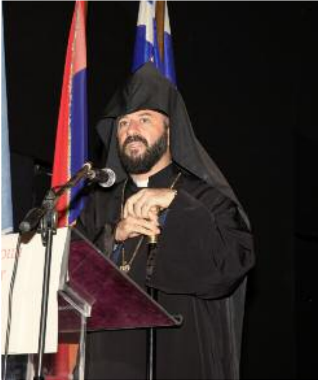
«Եւ այս է յաղթութիւնս՝ որ յաղթէ աշխարհի, հաւատքն մեր» (Ա Հովհ. Ե 4):

(Ընթերցում Յունահայոց Թեմի Առաջնորդական Տեղապահ՝ Տեր Խորեն Վրդ. Առաքելեանի կողմէ)