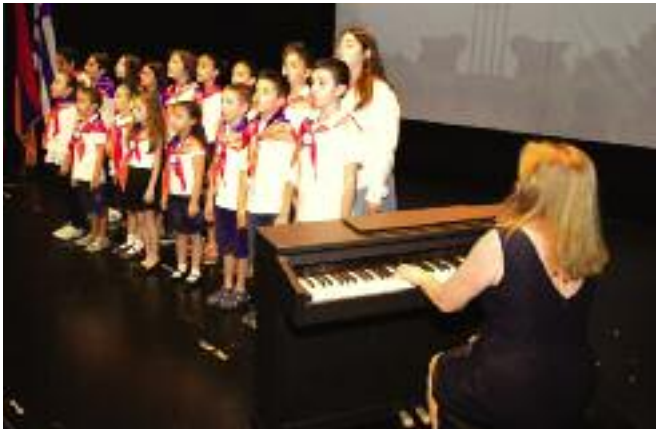
Ա. Գալփաքեան վարժարանի աշակերտները

Յունահայ թեմի՝ Առաջնորդական տեղապահ Հայր Խորէն Վրդ. Առաքելեան եւ բոլոր ազգային եկեղեցական կազմակերպութիւնները եւ յարգարժան