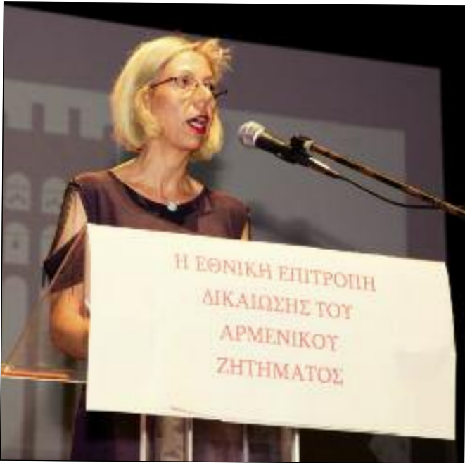
Արժանապատիւ Հոգեւոր Հայրեր Յարգարժան պաշտօնական անձնատրութիւններ եւ