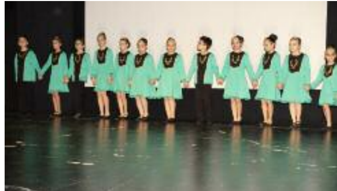
"Աւետիս" պատանեկան պարախումբ

Հանդիսութիւնը վերջ գտաւ գեղարուեստական կոկիկ եւ բովանդակալից յայտագրով, ուր «Աւետիս» պարախումբի պատանեկան խումբը երկու հայկական պարեր ներկայացուց եւ Հ.Բ.Ը.Միութեան «Անի» պարախումբի ելոյթներով դեկա-