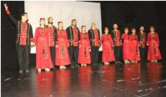
Հ.Բ.Ը.Միութեան "Անի" պարախումբ

Յայտագիրը շարունակուեցաւ ողջոյնի խօսքերով, Յունահայոց թեմական խորհուրդի